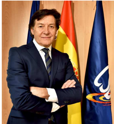
José Ramón Lete Lasa

Presidente del Consejo Superior de Deportes